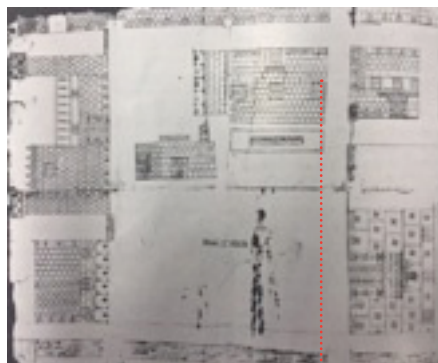
Imagen 3. Mapa de 1562

“Para el número y concurrencia de estudiantes tiene bastante amplitud el patio; y por este lado izquierdo hay espacio sobrado para cuadrar el edificio, igualando el lado derecho...”(Cervantes de Salazar, 2001: 4 y 5).