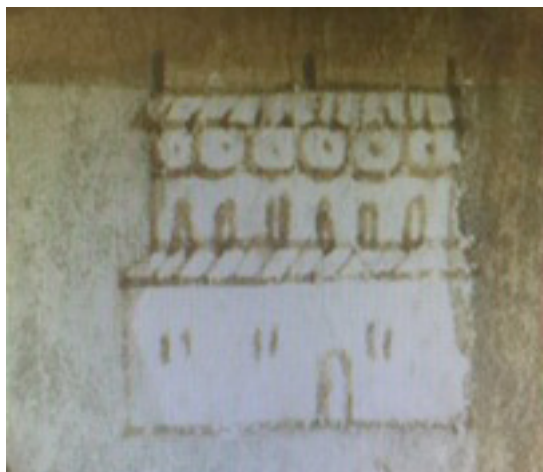
Imagen 2: Edificio que ocupó la Universidad. Detalle del mapa de Uppsala

“¿Qué edificio es éste con tantas y tan grandes ventanas arriba y abajo, que por un lado da a la plaza, y por el frente a la calle pública, en el cual entran los jóvenes ya de dos en dos, ya como si fueran acompañando a un maestro por honrarle, y llevan capas largas y bonetes cuadrados metidos hasta las orejas?”